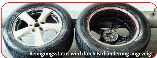
Reinigungsstatus wird durch Farbänderung angezeigt

Anwendungsbereich: Entfernt hochwirksam und selbsttätig hartnäckigen Schmutz auf Felgen, wie Bremsabrieb, Öl- und Gummirückstände. Auch bei RDKS (Reifendruckkontrollsystem) geeignet.