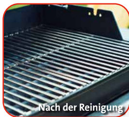
Nach der Reinigung