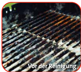
Vor der Reinigung

Anwendungsbereich: Zur rückstandslosen Entfernung eingebraunter Rückstände, frischem oder angetrocknetem Fett sowie Marinaden-Rückstände an Grill und Grillrost. Geeignet auch für Gasdüsen, Abdeckungen aus Edelstahl, emaillierte Grillroste und Kunststoffteile am Grill.